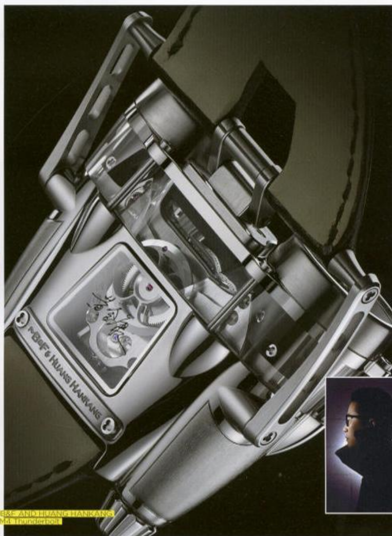
MEKE ANTO ELIANO HANKANS HM011 (under watch)