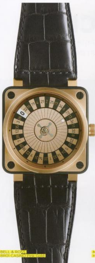
BELL & ROSS BROI CASINO pink gold