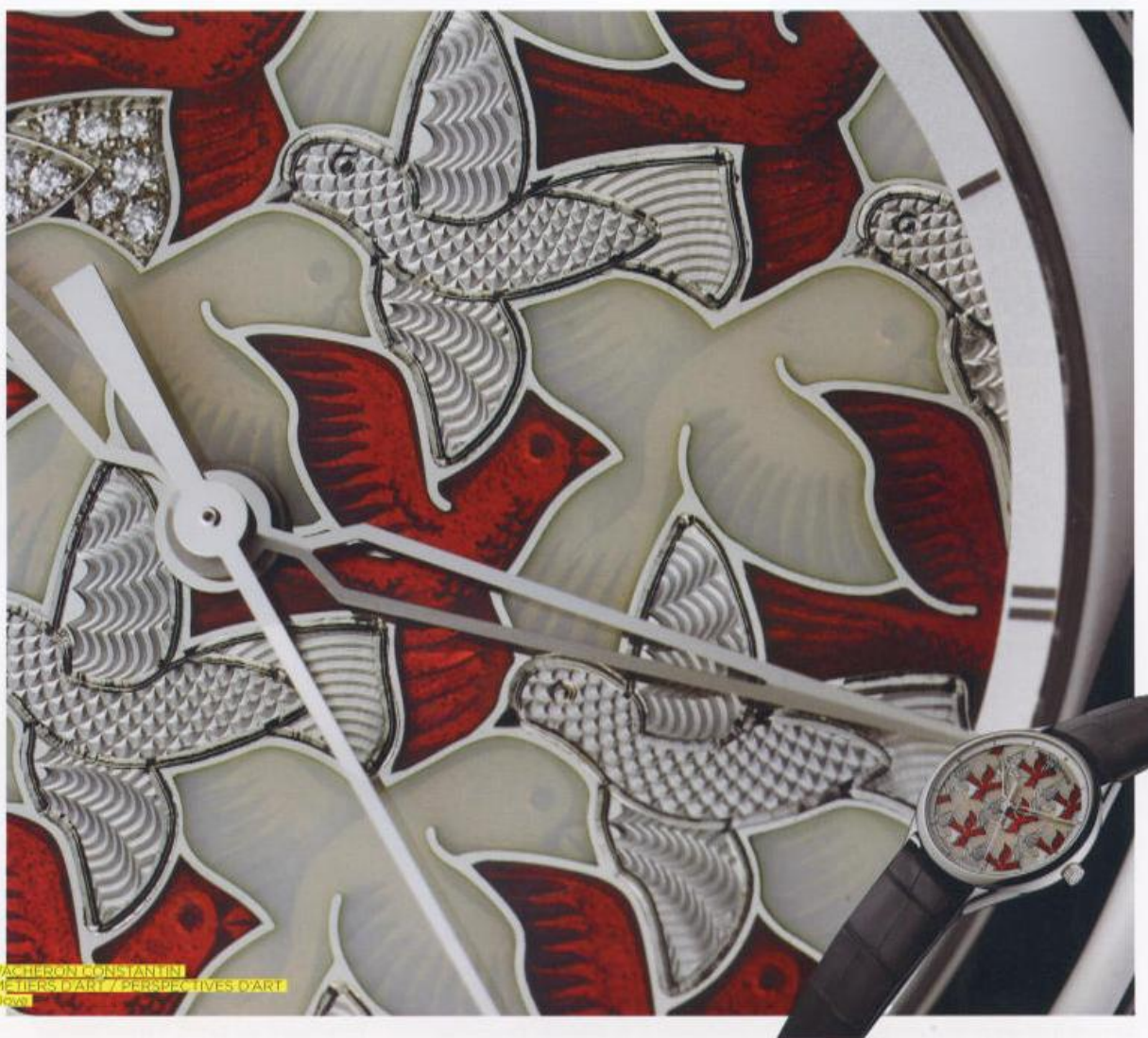
VACHERON CONSTANTIN METERS D'ART / PERSPECTIVES D'ART D'ART

Friends (MB&F) che metterà all'asta un'edizione rivistata dell' HM4 Thunderbolt . "L'aeroplano" della manifattura è stato impreziosito dalla miniscultura dell'artista cinese Huang Hankang, un panda in oro realizzato a mano che tiene le redini dell'ultimo segnatempo nato dalla creatività di Maximilian Busser. Un'opera artigiana veramente speciale come quella che Vacheron Constantin ha pensato per Only Watch 2011. La