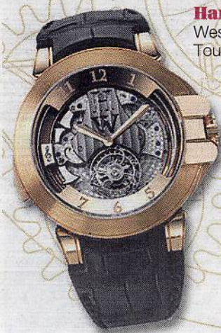
Harry Winston Westminster Tourbillon