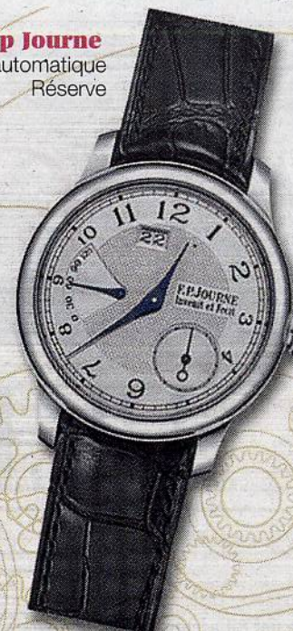
Fp Journe Octa automatique Réserve