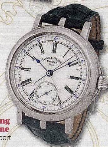
Lang & Heyne Albert

nomia e un nuovo sistema di ricarica automatica. Il rotore è montato su un cuscinetto con sfere di ceramica e monta un dispositivo di ritorno in posizione che rende più efficiente il sistema di ricarica. Elegantissimo nella sua semplicità, ha la cassa in platino, costa 25.800 euro e sarà disponibile prima dell'estate.