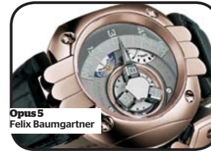
Opus 5 Felix Baumgartner