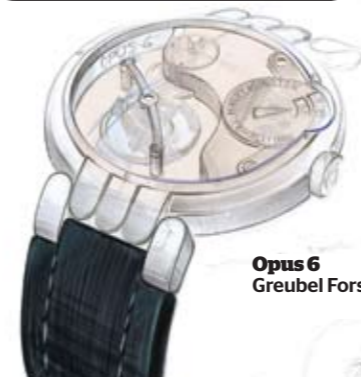
Opus 6 Greubel Forsey