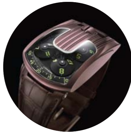
UR 103 oro rosa