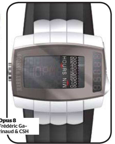
Opus 8 Frédéric Girard & CSH