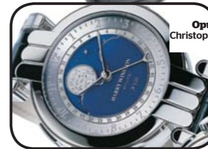
Opus 4 Christophe Claret