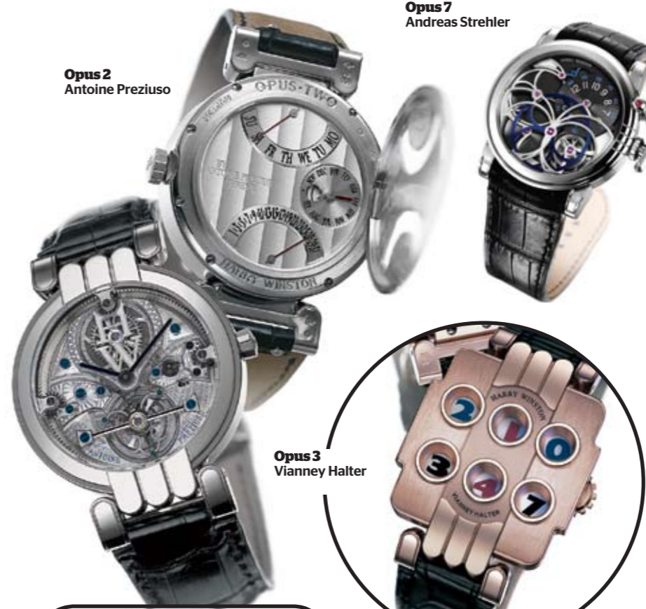
Opus 2 Antoine Preziuso