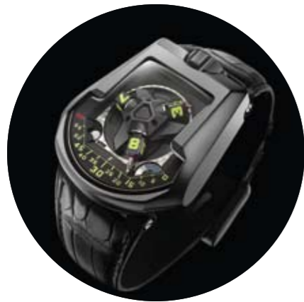
URWERK UR 202 AITIN