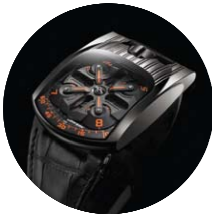
UR 103T Mexican Fireleg