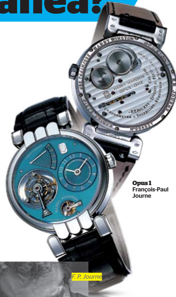
Opus 1 François-Paul Journe

Avancemos dos décadas, hasta los años 90, y veremos el comienzo de la expansión masiva de los teléfonos celulares. Como