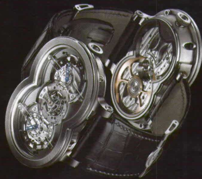
Turbilhão MB&F Horlogical Machine N° 1, edição limitada a 10 peças em titânio