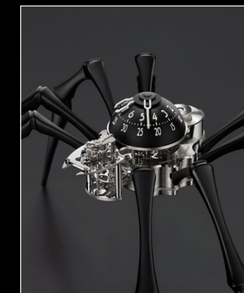
ARACHNOPHOBIA BLACK CLOSE UP