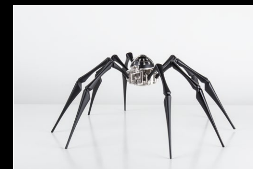
ARACHNOPHOBIA IN SITU 3