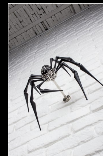
ARACHNOPHOBIA IN SITU 1