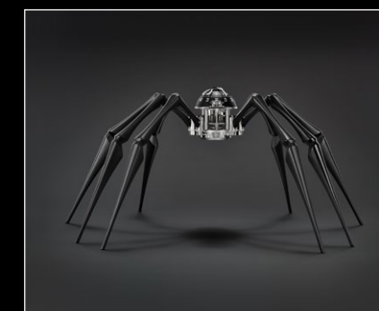
ARACHNOPHOBIA BLACK FACE