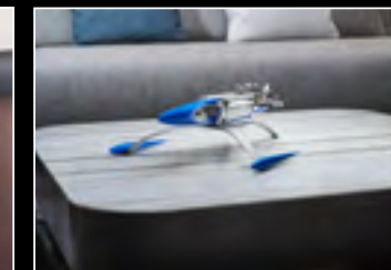
MUSICMACHINE 1 RELOADED BLUE - LIFESTYLE