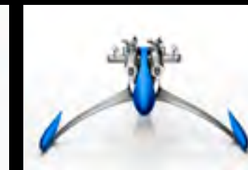
MUSICMACHINE 1 RELOADED BLUE - FACE