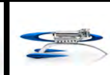
MUSICMACHINE 1 RELOADED BLUE - PROFILE