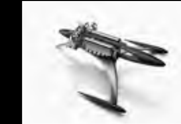
MUSICMACHINE 1 RELOADED BLACK