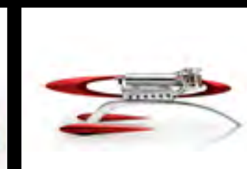
MUSICMACHINE 1 RELOADED RED - PROFILE