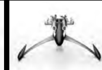
MUSICMACHINE 1 RELOADED BLACK - FACE