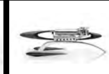
MUSICMACHINE 1 RELOADED BLACK - PROFILE