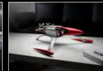
MUSICMACHINE 1 RELOADED RED - LIFESTYLE