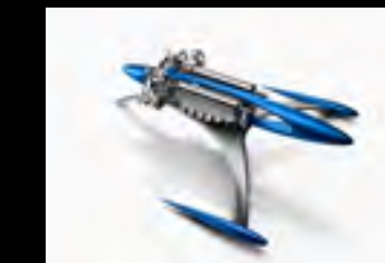
MUSICMACHINE 1 RELOADED BLUE