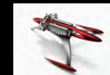
MUSICMACHINE 1 RELOADED RED