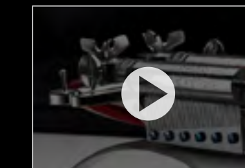
MUSICMACHINE 1 RELOADED MOVIE