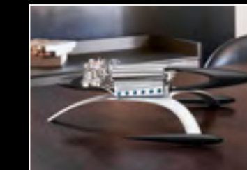
MUSICMACHINE 1 RELOADED BLACK - LIFESTYLE