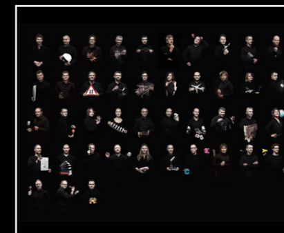
MEGAWIND FINAL EDITION FRIENDS LANDSCAPE