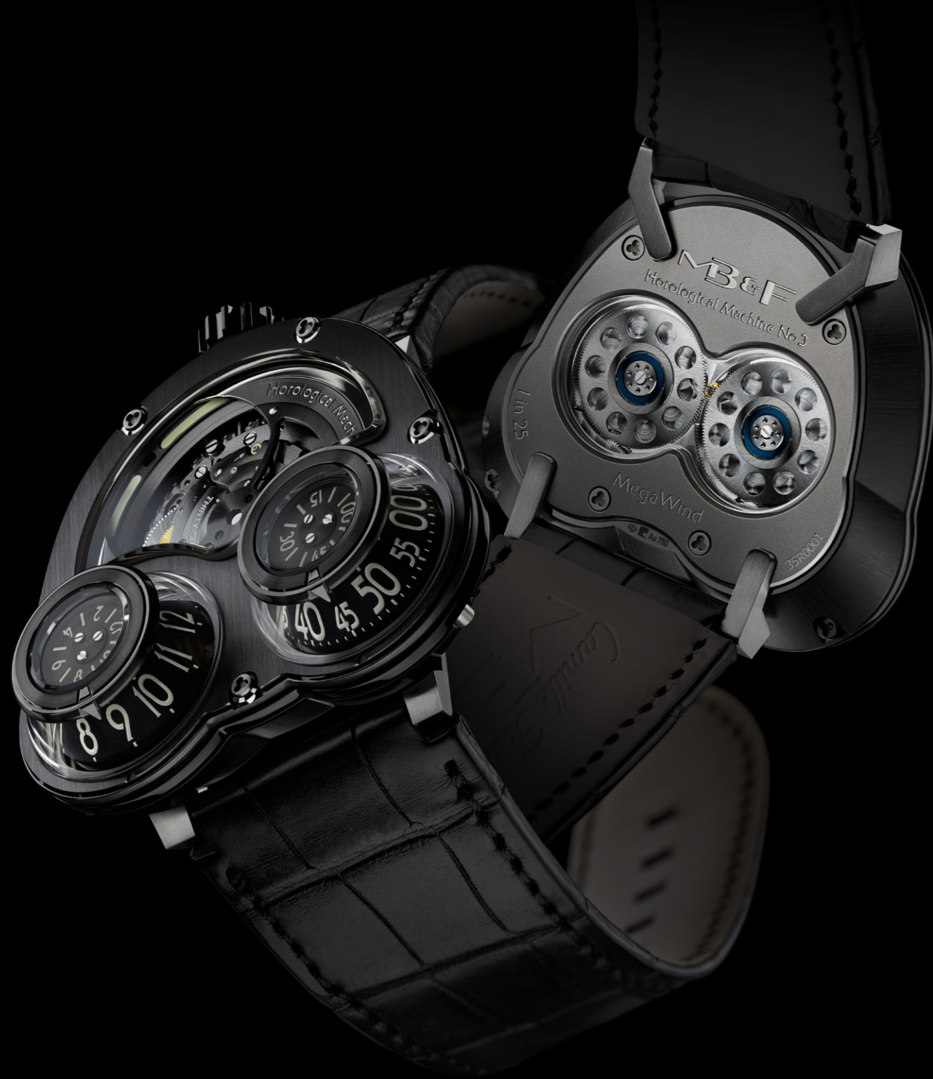
MB&F MEGAWIND FINAL EDITION LIMITED EDITION OF 25 PIECES