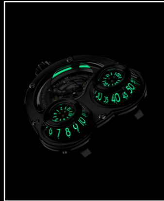
MEGAWIND FINAL EDITION SUPER LUMINOVA