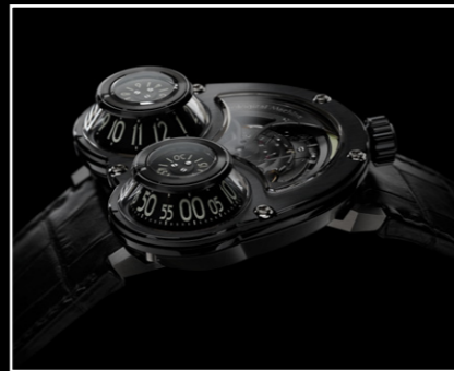
MEGAWIND FINAL EDITION PROFILE

PER ULTERIORI INFORMAZIONI CONTATTARE: CHARRIS YADIGAROGLOU, MB&F SA, RUE VERDAINE II, CH-1204 GINEVRA, SVIZZERA EMAIL: CY@MBANDF.COM TEL: +41 22 508 10 33