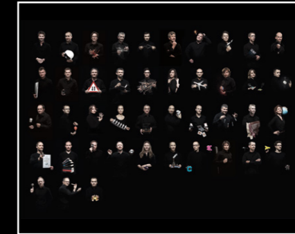
MEGAWIND FINAL EDITION FRIENDS LANDSCAPE