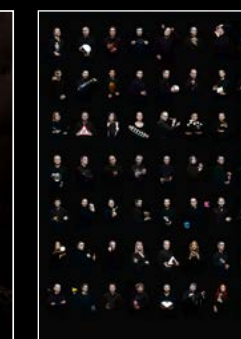
HM6 SERIES FRIENDS PORTRAIT