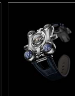
HM6 FINAL EDITION FRONT