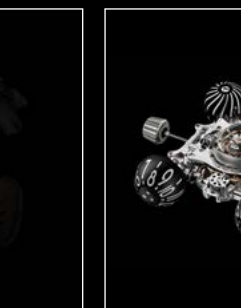
HM6 SERIE ENGINE 01