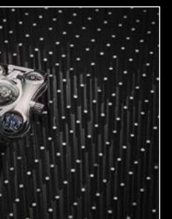
HM6 FINAL EDITION WRIST SHOT