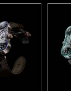
HM6 ALIEN NATION FRONT