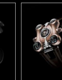
HM6 RT FRONT