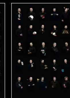
HM6 SERIES FRIENDS LANDSCAPE