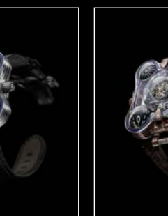
HM6 SV RED FRONT