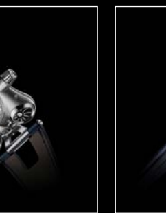
HM6 FINAL EDITION PROFILE