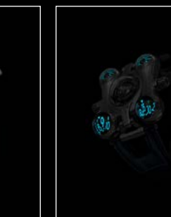
HM6 FINAL EDITION FRONT - NIGHT