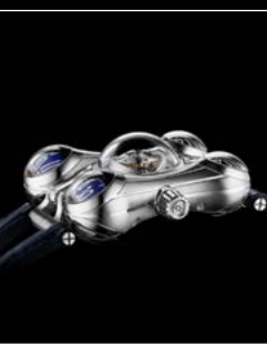
HM6 FINAL EDITION CLOSE UP TOURBILLON