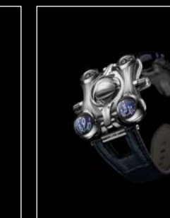
HM6 FINAL EDITION FRONT - SHIELD