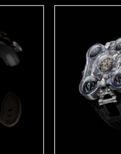
HM6 SV PLATINUM FRONT