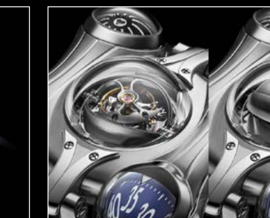
HM6 FINAL EDITION CLOSE UP TOURBILLON