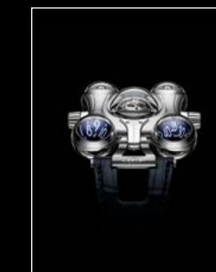
HM6 FINAL EDITION FACE