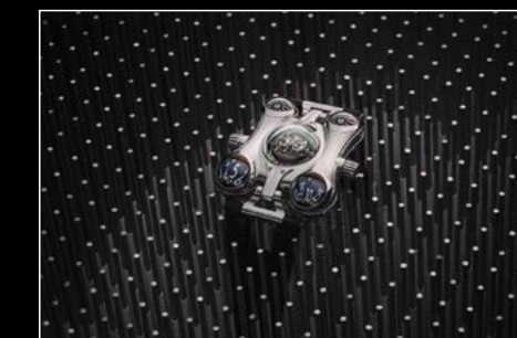
HM6 FINAL EDITION LIVE SHOT