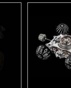
HM6 SERIE ENGINE 01