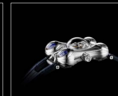
HM6 FINAL EDITION PROFILE