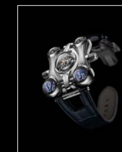
HM6 FE FRONT