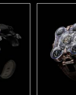
HM6 SV RED FRONT