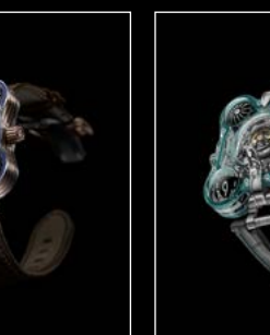
HM6 ALIEN NATION FRONT