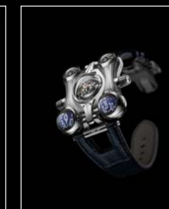
HM6 FINAL EDITION FRONT