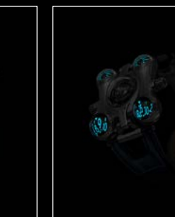
HM6 FINAL EDITION FRONT - NIGHT