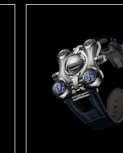
HM6 FINAL EDITION FRONT - SHIELD