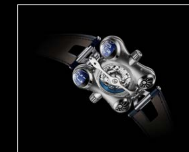
HM6 FINAL EDITION BACK