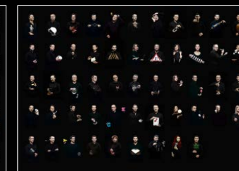
HM6 SERIES FRIENDS LANDSCAPE