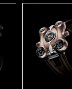
HM6 RT FRONT