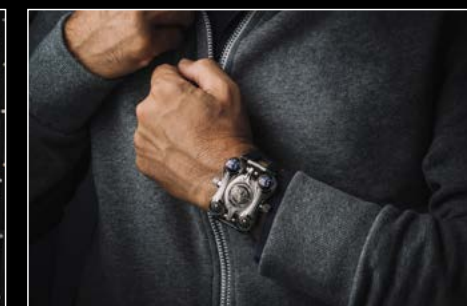
HM6 FINAL EDITION WRIST SHOT