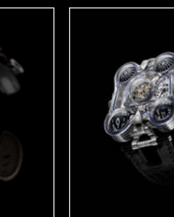
HM6 SV PLATINUM FRONT