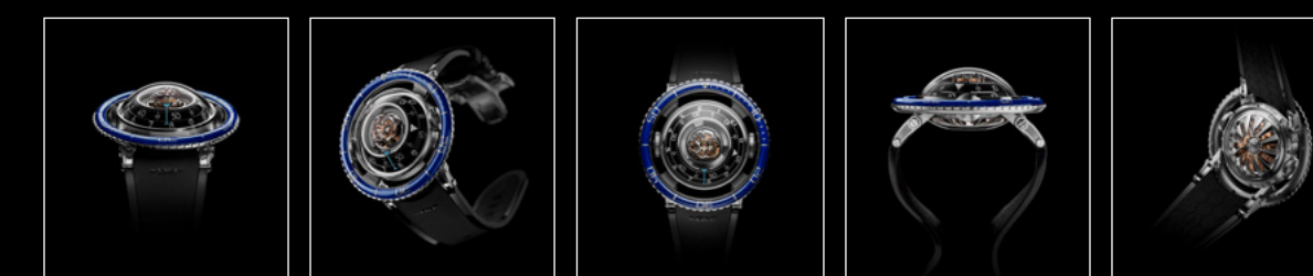
HM7 AQUAPOD TI BLUE FACE HM7 AQUAPOD TI BLUE FRONT HM7 AQUAPOD TI BLUE TOP HM7 AQUAPOD TI BLUE PROFILE HM7 AQUAPOD TI BLUE BACK