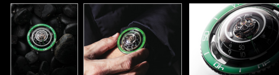
HM7 AQUAPOD TI GREEN LIVE SHOT HM7 AQUAPOD TI GREEN WRIST SHOT HM7 AQUAPOD TI GREEN CLOSE-UP