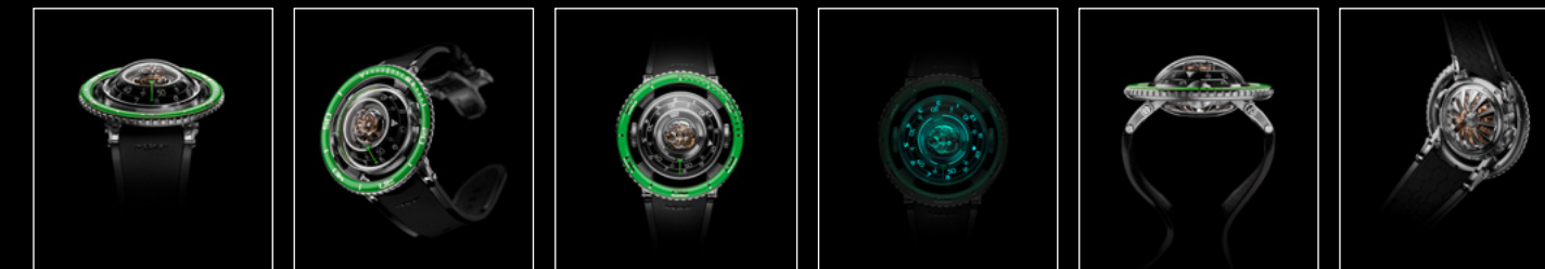
HM7 AQUAPOD TI GREEN FACE HM7 AQUAPOD TI GREEN FRONT HM7 AQUAPOD TI GREEN TOP HM7 AQUAPOD TI GREEN NIGHT HM7 AQUAPOD TI GREEN PROFILE HM7 AQUAPOD TI GREEN BACK