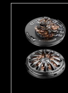
HM7 AQUAPOD ENGINE