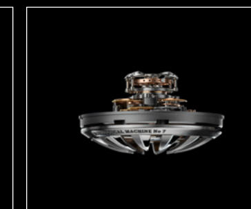
HM7 AQUAPOD ENGIN PROFILE