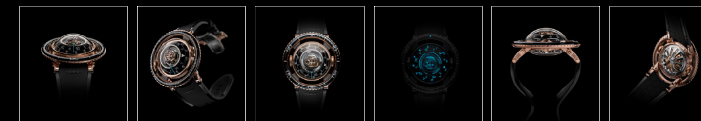
HM7 AQUAPOD RG FACE HM7 AQUAPOD RG FRONT HM7 AQUAPOD RG TOP HM7 AQUAPOD RG TOP NIGHT HM7 AQUAPOD RG PROFILE HM7 AQUAPOD RG BACK