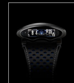
HMX BLUE FACE