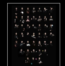
HMX FRIENDS PORTRAIT