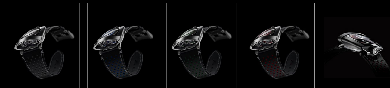
HMX BLACK FRONT