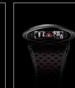
HMX RED FACE