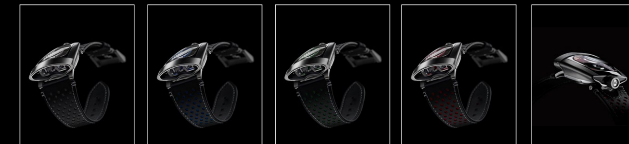
HMX BLACK FRONT