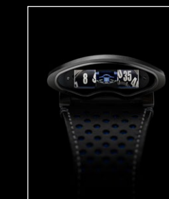
HMX BLUE FACE