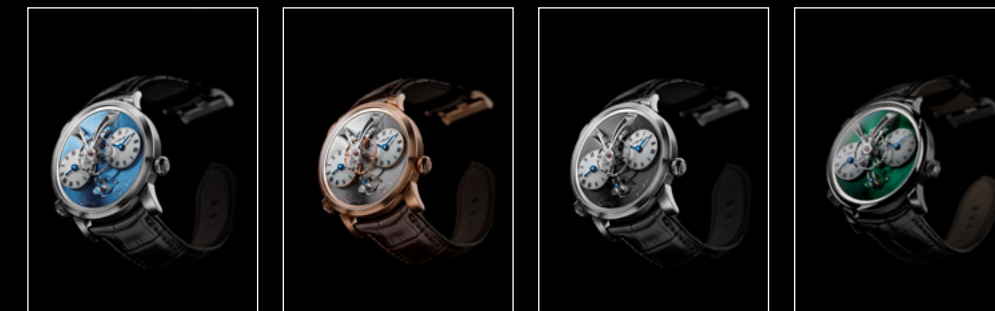
LEGACY MACHINE N°1 PLATINUM