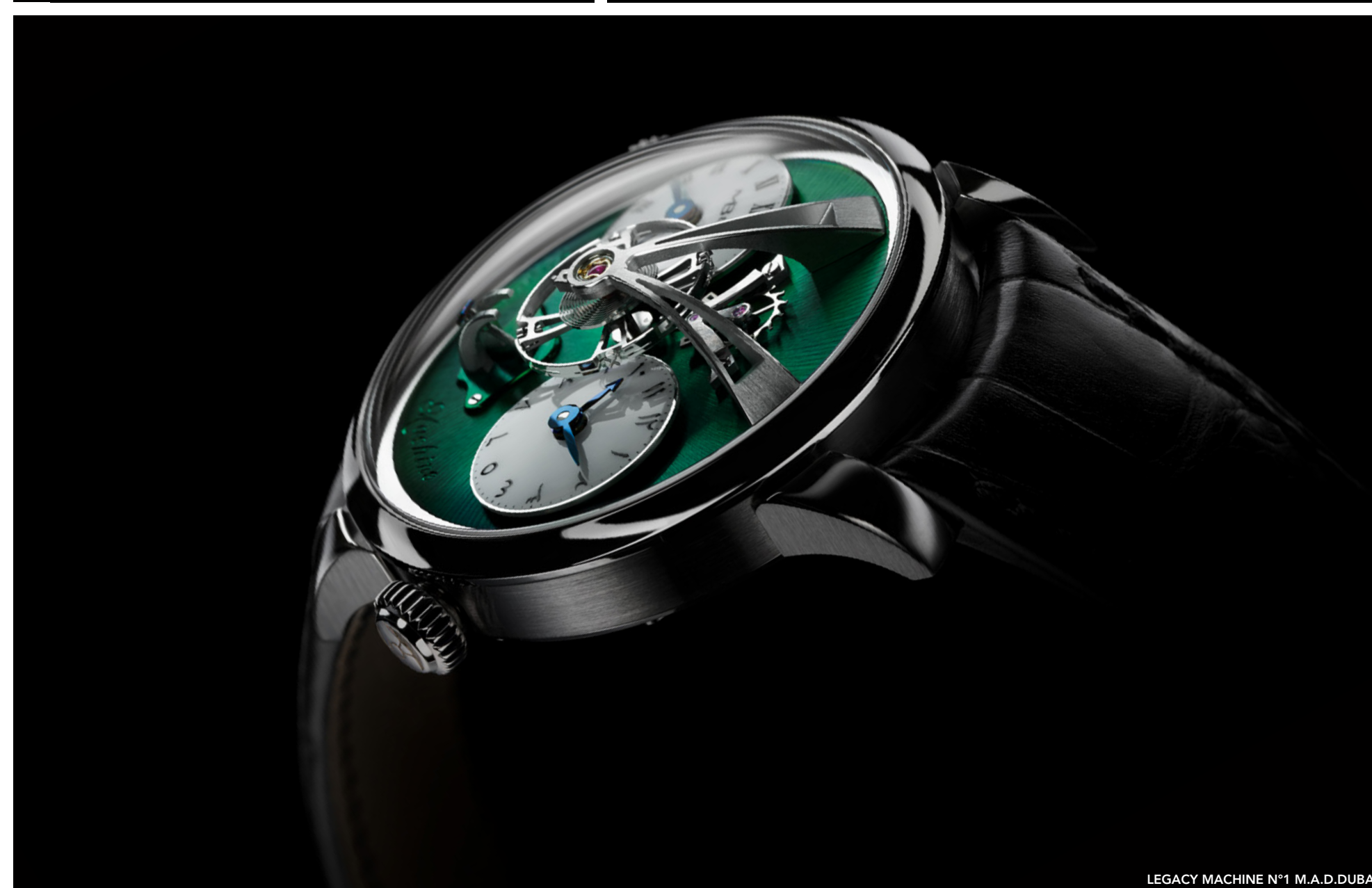
LEGACY MACHINE N°1 M.A.D.DUBAI