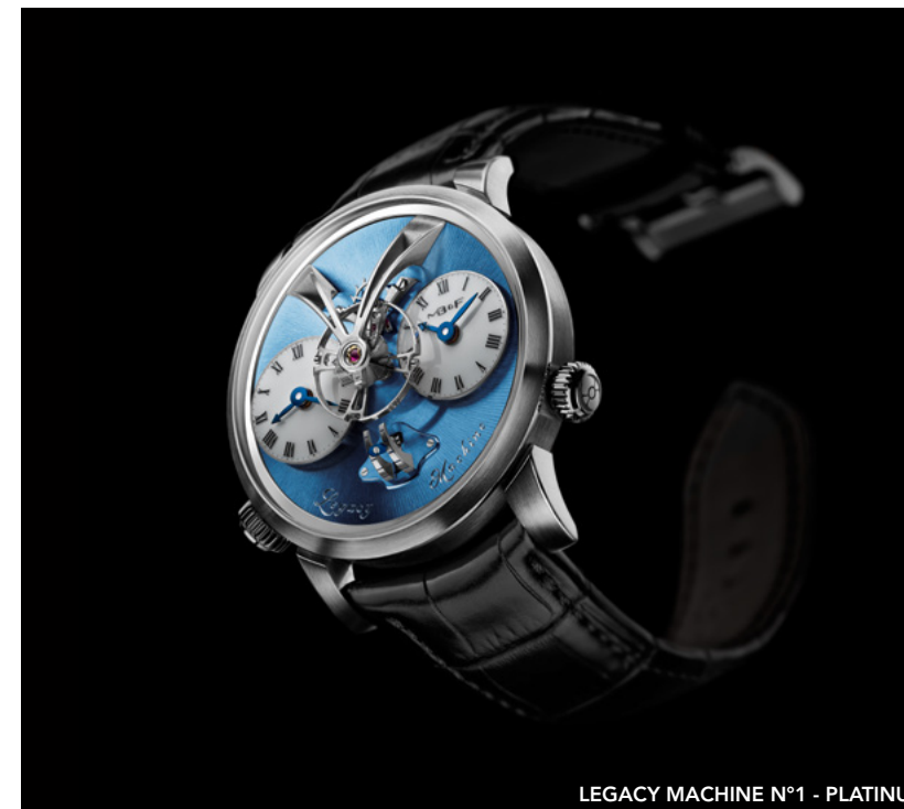
LEGACY MACHINE N°1 - PLATINUM