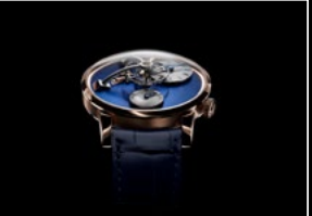
LM101 RG BLUE FACE