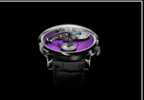
LM101 WG PURPLE FACE