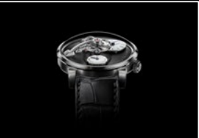
LM101 WG FACE