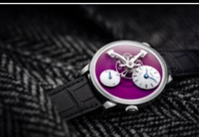
LM101 WG PURPLE LIFESTYLE