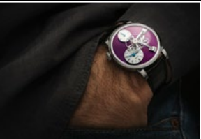
LM101 WG PURPLE WRISTSHOT