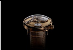
LM101 FROST YG FACE