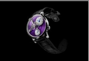
LM101 WG PURPLE FRONT