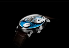
LM101 STEEL BLUE PROFILE