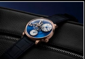
LM101 RG BLUE LIFESTYLE