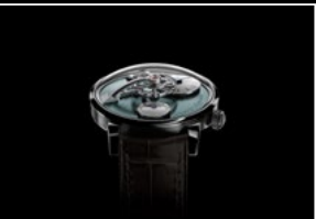
LM101 PALLADIUM FACE