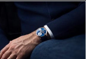
LM101 RG BLUE WRISTSHOT