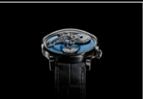
LM101 PT FACE