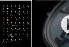
FRIENDS LM101 PORTRAIT