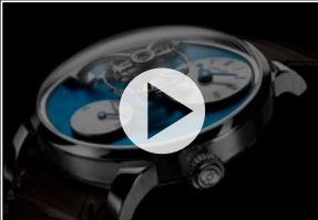
MOVIE LM101 2021