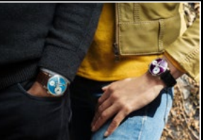
LM101 STEEL BLUE & WG PURPLE WRISTSHOT