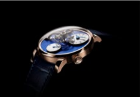
LM101 RG BLUE PROFILE