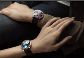
LM101 WG PURPLE & RG BLUE WRISTSHOT