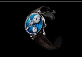
LM101 STEEL BLUE FRONT