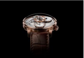
LM101 RG FACE