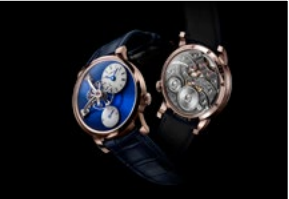
LM101 RG BLUE