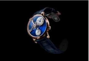
LM101 RG BLUE FRONT