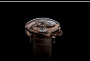
LM101 FROST RG FACE