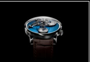
LM101 STEEL BLUE FACE