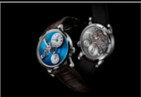
LM101 STEEL BLUE