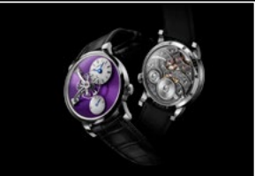
LM101 WG PURPLE