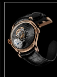
LM FlyingT RG FRONT