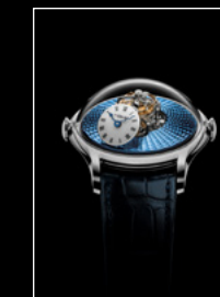
LM FlyingT PT FACE