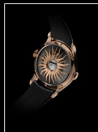
LM FlyingT RG BACK