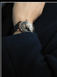
LM FlyingT LIVE SHOT 1