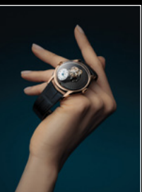
LM FlyingT LIVE SHOT 2