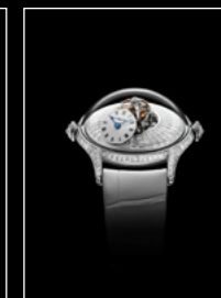
LM FlyingT BAGUETTE FACE