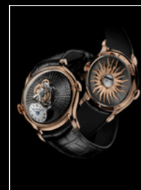
LM FlyingT RG