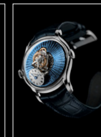
LM FlyingT PT FRONT