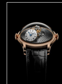
LM FlyingT RG FACE