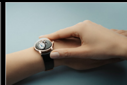
LM FlyingT WRISTSHOT