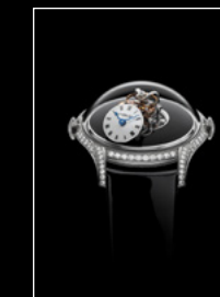
LM FlyingT LAQUE FACE