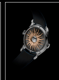
LM FlyingT PT BACK