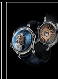
LM FlyingT PT