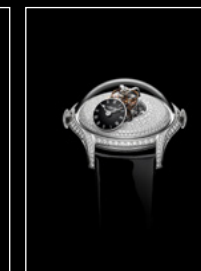
LM FlyingT PAVE FACE