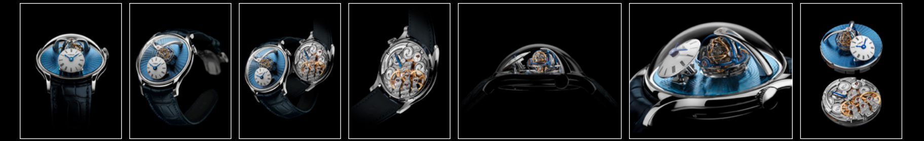
LM THUNDERDOME PLATINUM FACE