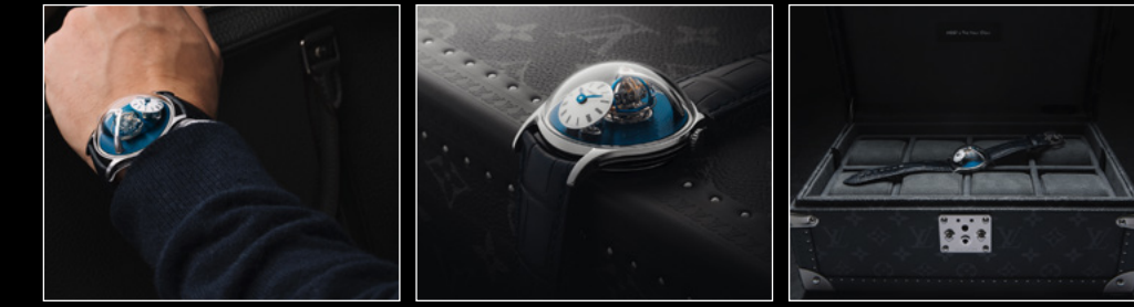
LM THUNDERDOME TANTALUM WRISTSHOT