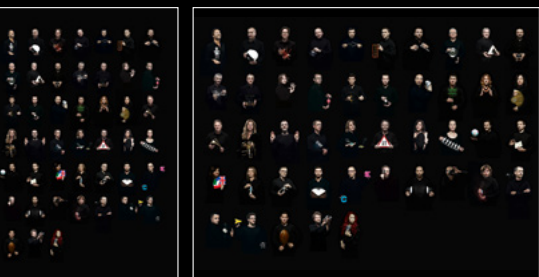
LM THUNDERDOME PORTRAIT