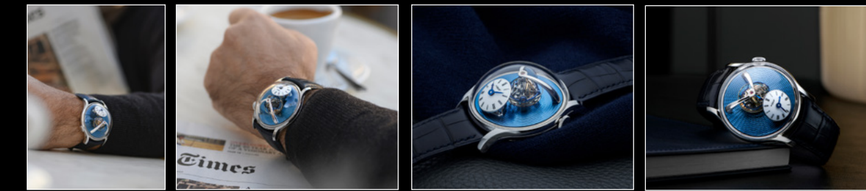
LM THUNDERDOME WRISTSHOT 1