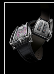
HM8 ONLY WATCH