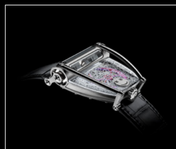
HM8 ONLY WATCH PROFILE