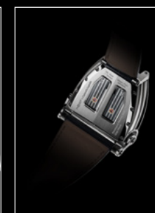
HM8 ONLY WATCH BACK