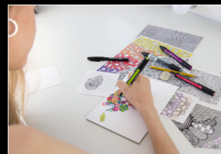
CASSANDRA LEGENDRE DRAWING