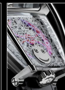
HM8 ONLY WATCH CLOSE-UP