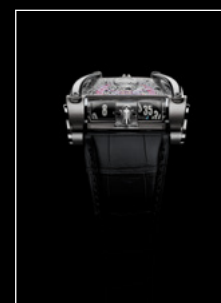
HM8 ONLY WATCH FACE