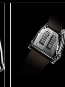
HM8 ONLY WATCH BACK