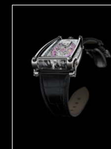
HM8 ONLY WATCH FRONT