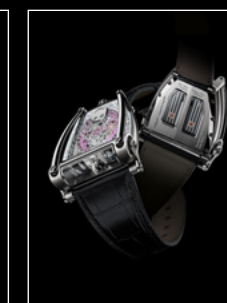
HM8 ONLY WATCH