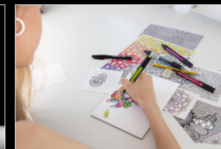
CASSANDRA LEGENDRE DRAWING