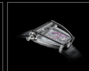
HM8 ONLY WATCH PROFILE