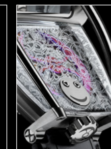
HM8 ONLY WATCH CLOSE-UP