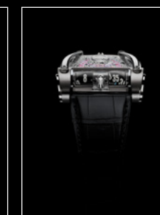
HM8 ONLY WATCH FACE