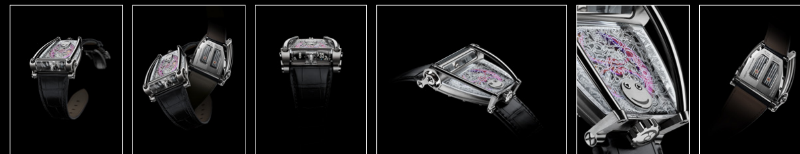
HM8 ONLY WATCH FRONT HM8 ONLY WATCH CLOSE-UP HM8 ONLY WATCH FACE HM8 ONLY WATCH PROFILE HM8 ONLY WATCH CLOSE-UP HM8 ONLY WATCH BACK