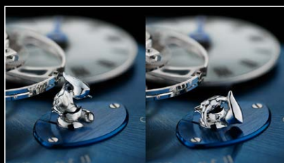
LMI XIA HANG WG POWER RESERVE MAN