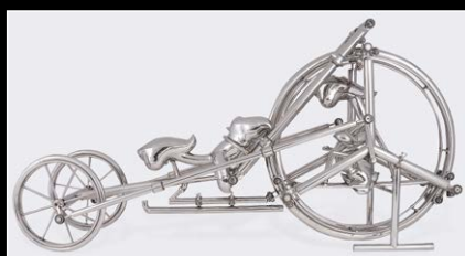
SCULPTURE 1 'COMING SOON'

Для получения дополнительной информации, пожалуйста, обращайтесь: CHARRIS YADIGAROGLOU, MB&F SA, RUE VERDAINE 11, CH-1204 GENEVA, SWITZERLAND EMAIL: CY@MBANDF.COM TEL: +41 22 508 10 33