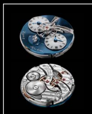
LMI XIA HANG WG