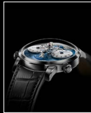
LMI XIA HANG WG FACE