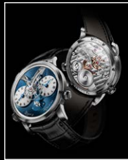
LMI XIA HANG WG