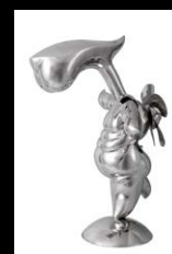
SCULPTURE 'NOT FAR'