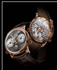
LMI XIA HANG RG