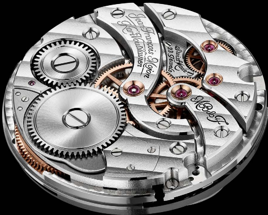
MB&F LMI XIA HANG - ENGINE