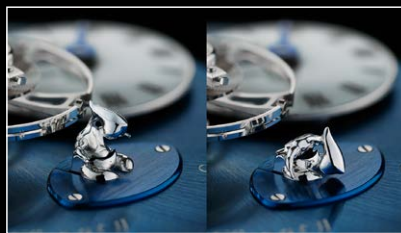
LMI XIA HANG WG POWER RESERVE MAN