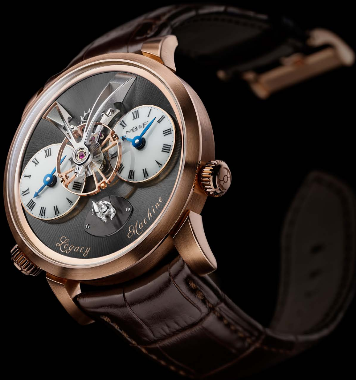
MB&F LMI XIA HANG - RED GOLD - LIMITED EDITION OF 12 PIECES