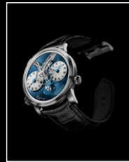
LMI XIA HANG WG FRONT