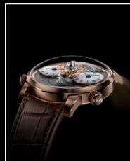
LMI XIA HANG RG FACE