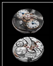
LMI XIA HANG RG