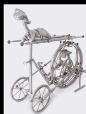
SCULPTURE 2 'COMING SOON'