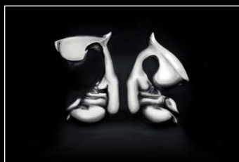
MR. UP & MR. DOWN