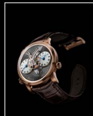
LMI XIA HANG RG FRONT