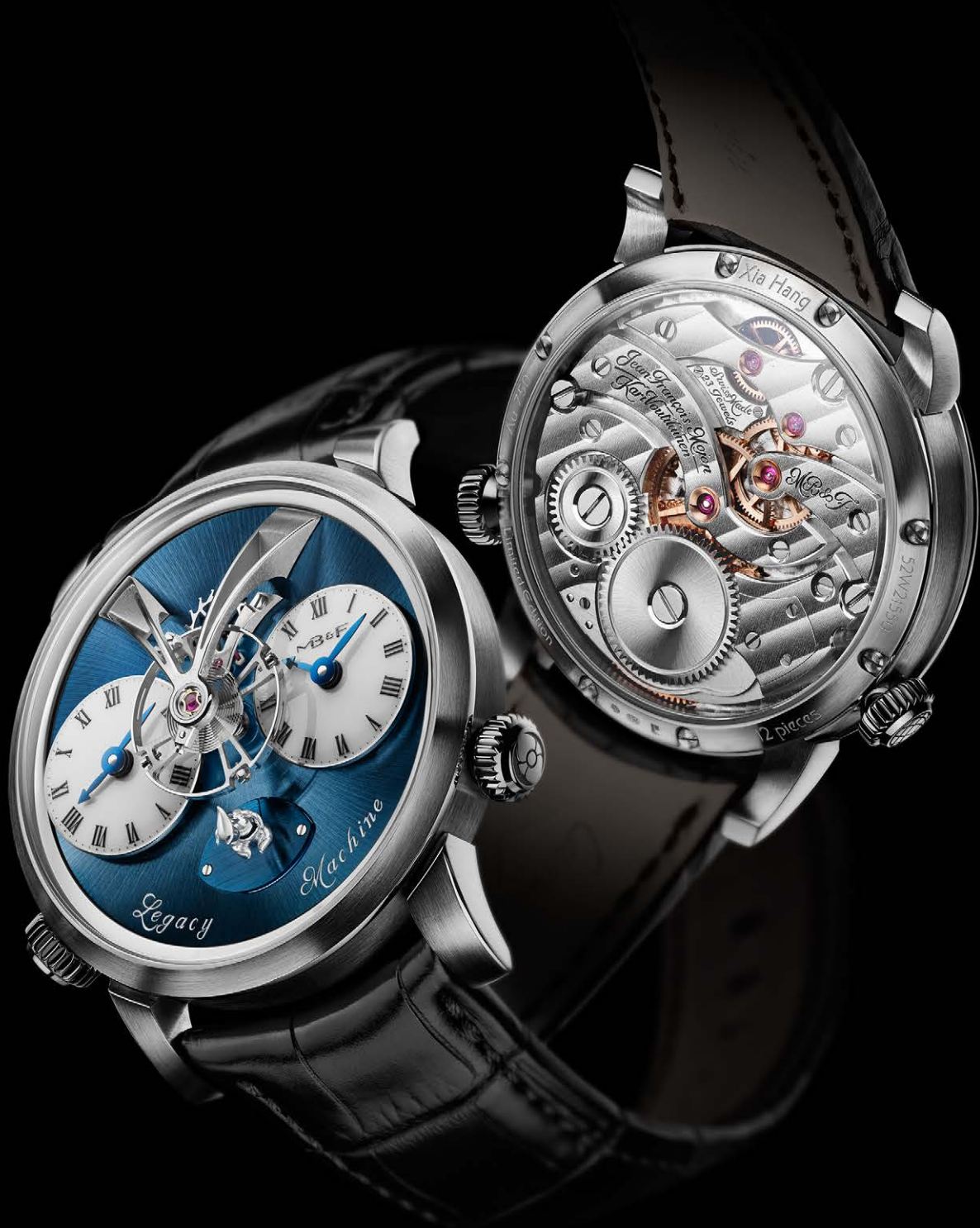
MB&F LMI XIA HANG - WHITE GOLD - LIMITED EDITION OF 12 PIECES