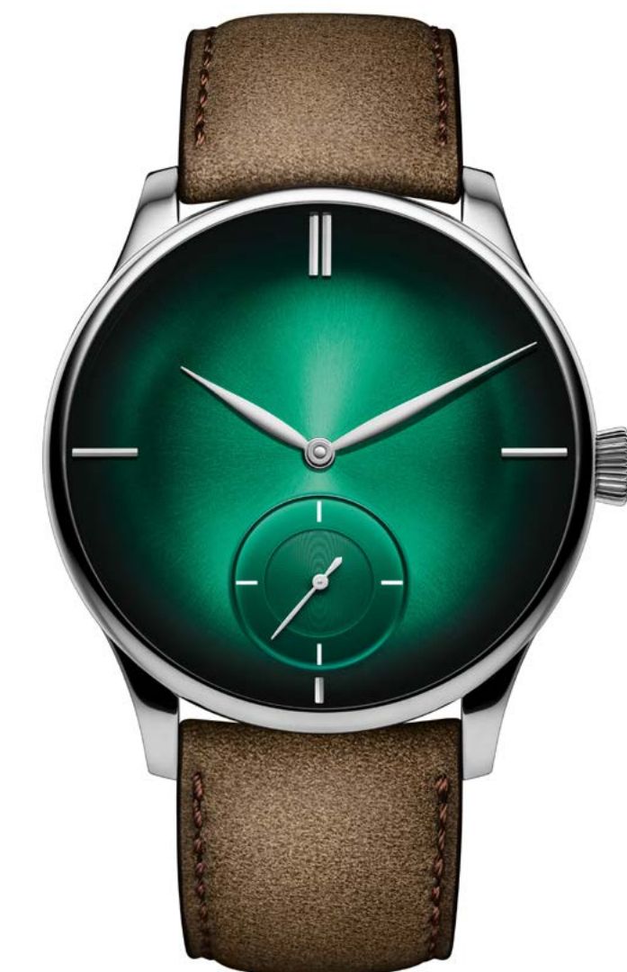
VENTURER SMALL SECONDS XL – H. MOSER & CIE.