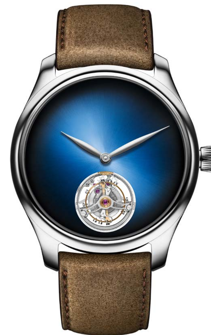
ENDEAVOUR TOURBILLON – H. MOSER & CIE.

WODAY COMMUNICATION OBENALTENDORF 17 21756 OSTEN TELEFON: +49 4776 888 9627 E-MAIL: PR@WODAY-COMMUNICATION.DE