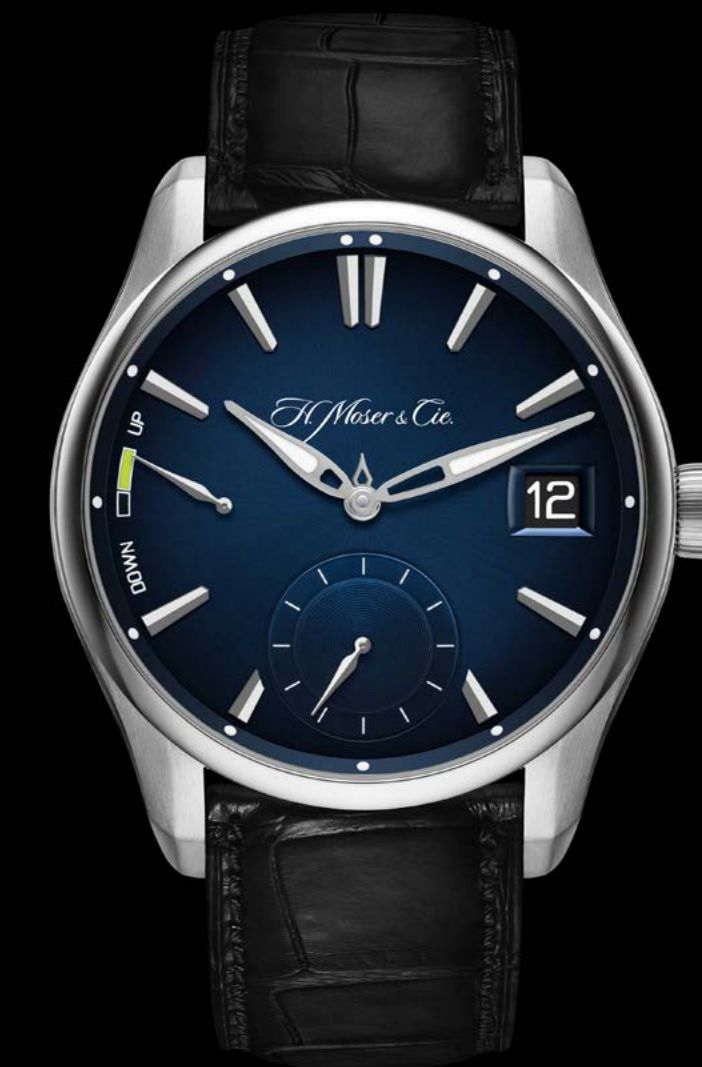
PIONEER PERPETUAL CALENDAR – H. MOSER & CIE.