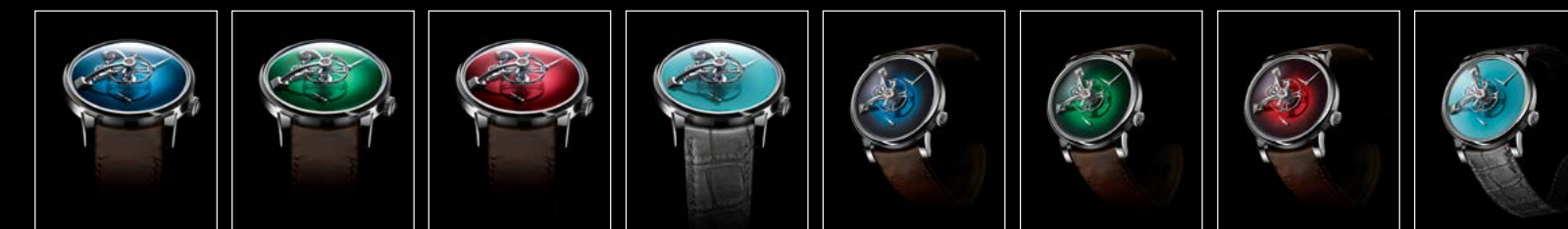
LM101 MB&F x MOSER BLUE FACE LM101 MB&F x MOSER GREEN FACE LM101 MB&F x MOSER RED FACE LM101 MB&F x MOSER SEDDIQI FACE LM101 MB&F x MOSER BLUE FRONT LM101 MB&F x MOSER GREEN FRONT LM101 MB&F x MOSER RED FRONT LM101 MB&F x MOSER SEDDIQI FRONT