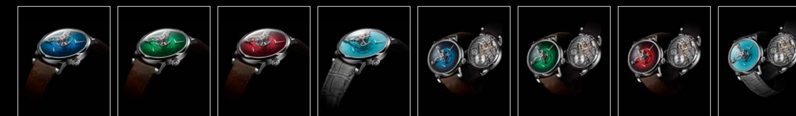
LM101 MB&F x MOSER BLUE PROFILE LM101 MB&F x MOSER GREEN PROFILE LM101 MB&F x MOSER RED PROFILE LM101 MB&F x MOSER SEDDIQI PROFILE LM101 MB&F x MOSER BLUE RECTO/VERSO LM101 MB&F x MOSER GREEN RECTO/VERSO LM101 MB&F x MOSER RED RECTO/VERSO LM101 MB&F x MOSER SEDDIQI RECTO/VERSO