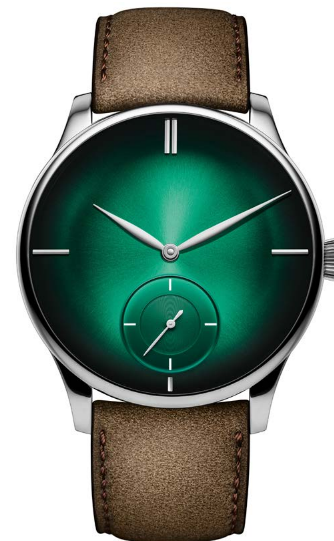
VENTURER SMALL SECONDS XL - H. MOSER & CIE.