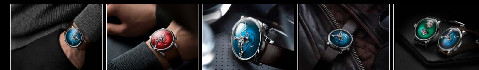
LM101 MB&F x MOSER WRISTSHOT BLUE LM101 MB&F x MOSER WRISTSHOT RED LM101 MB&F x MOSER LIFESTYLE 01 LM101 MB&F x MOSER LIFESTYLE 02 MB&F x H. MOSER LIFESTYLE