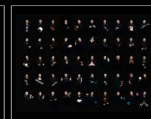
LM101 MB&F x MOSER FRIENDS LANDSCAPE