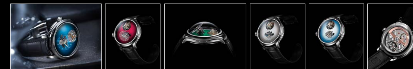
ENDEAVOUR TOURBILLON H. MOSER x MB&F ENDEAVOUR TOURBILLON H. MOSER x MB&F ENDEAVOUR TOURBILLON H. MOSER x MB&F ENDEAVOUR TOURBILLON H. MOSER x MB&F ENDEAVOUR TOURBILLON H. MOSER x MB&F ENDEAVOUR TOURBILLON H. MOSER x MB&F