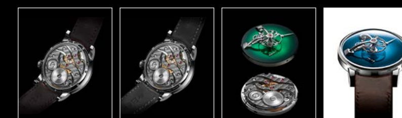
LM101 MB&F x MOSER BACK LM101 MB&F x MOSER SEDDIQI BACK LM101 MB&F x MOSER ENGINE LM101 MB&F x MOSER FACE WHITE