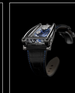
MOONMACHINE 2 BLACK TITANIUM FRONT