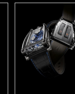
MOONMACHINE 2 BLACK TITANIUM