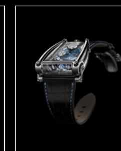
MOONMACHINE 2 TITANIUM FRONT