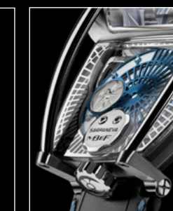
MOONMACHINE 2 TITANIUM CLOSE-UP