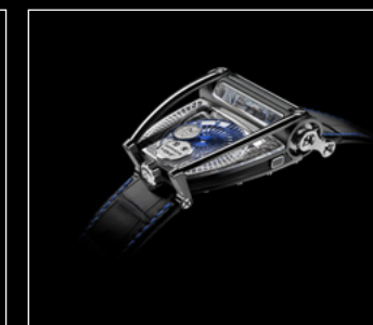
MOONMACHINE 2 BLACK TITANIUM PROFILE