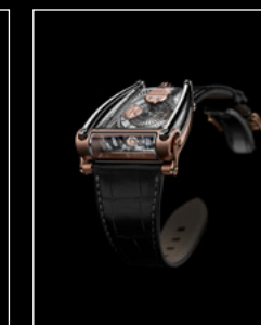
MOONMACHINE 2 RED GOLD FRONT