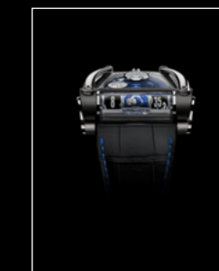
MOONMACHINE 2 BLACK TITANIUM FACE