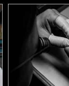
MOONMACHINE 2 SARPANEVA WORKSHOP 2