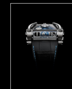
MOONMACHINE 2 TITANIUM FACE