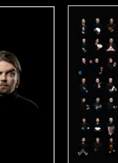
MOONMACHINE 2 FRIENDS PORTRAIT