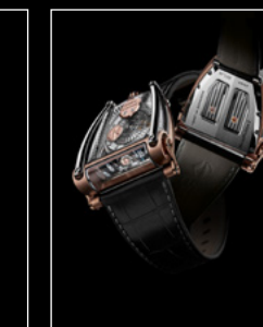
MOONMACHINE 2 RED GOLD