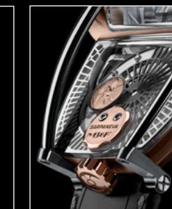
MOONMACHINE 2 RED GOLD CLOSE-UP