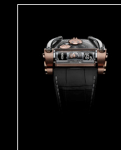
MOONMACHINE 2 RED GOLD FACE