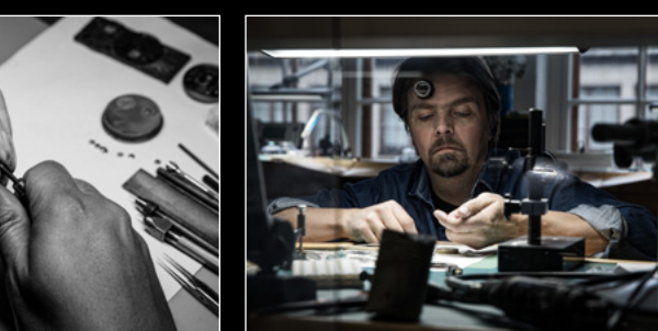
MOONMACHINE 2 SARPANEVA WORKSHOP 3