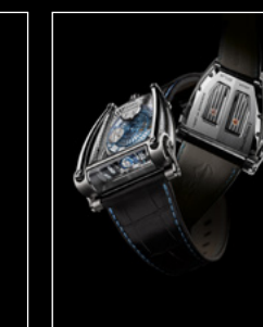
MOONMACHINE 2 TITANIUM