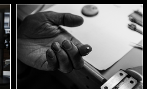
MOONMACHINE 2 SARPANEVA WORKSHOP 4