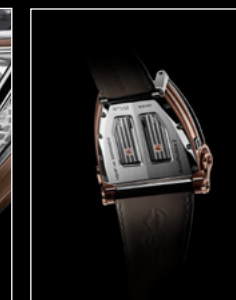
MOONMACHINE 2 RED GOLD BACK