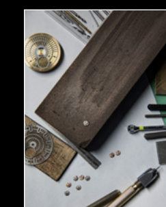
MOONMACHINE 2 SARPANEVA WORKSHOP 1