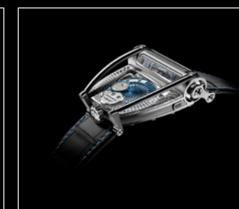
MOONMACHINE 2 TITANIUM PROFILE