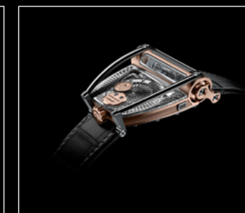
MOONMACHINE 2 RED GOLD PROFILE